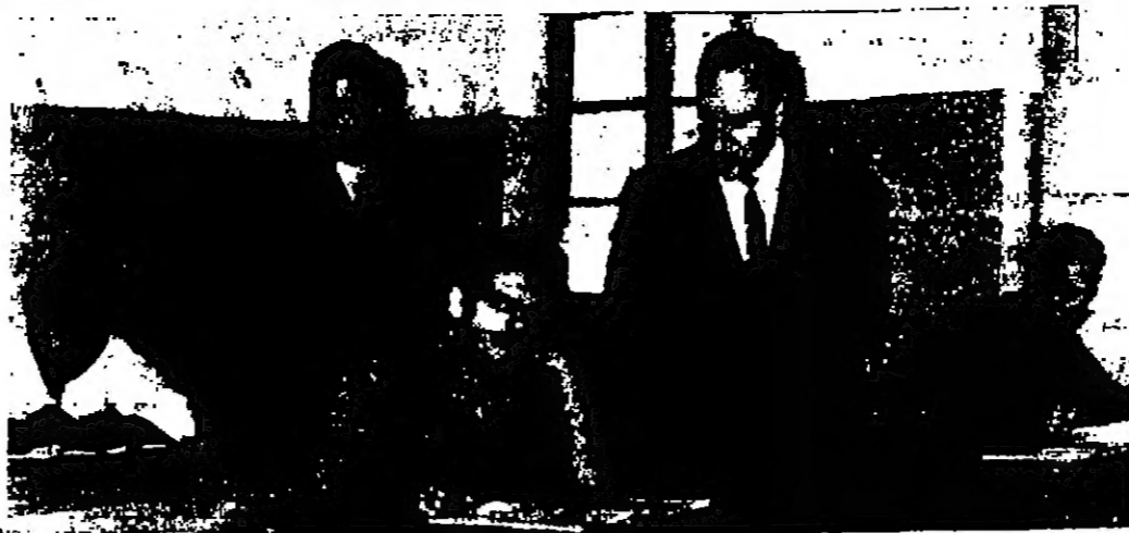
السيد بشر الصباغ وزير التربية والتعليم يفتتح قاعة نفس الدراسة الثانوية في الزرقاء يرافقه السيد عبد القادر العمري مدير التعليم في المواء